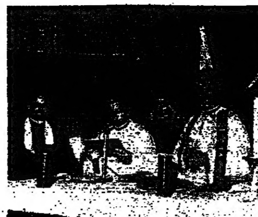
الابن بولس تويري يرأس الصلاة